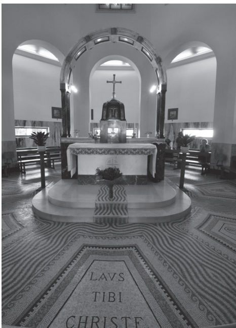
Oltář v kostele Blahoslavenství