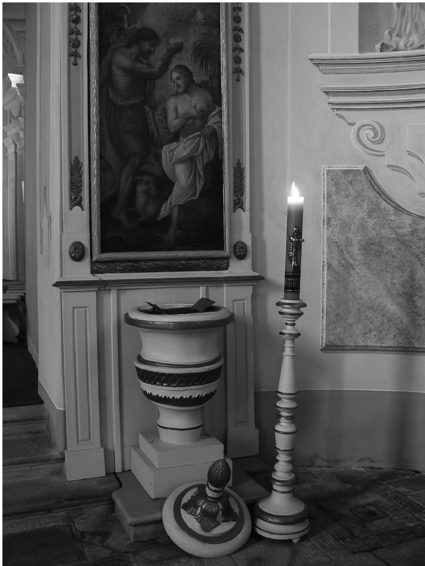
Křtitelnice s paškálem v poutním kostele Panny Marie Karmelské v Kostelním Vydří