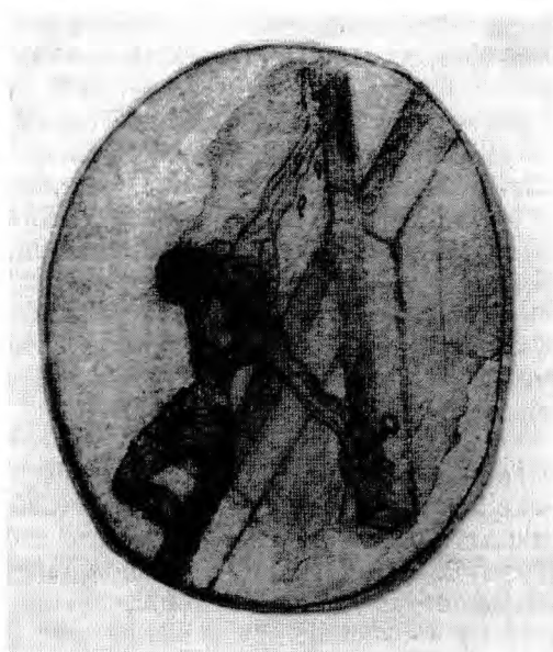
Sv. Jan od Kříže, Kristus z kláštera Vtělení

slavná kresba, nazývaná „Kristus z kláštera Vtělení“, která se dochovala až do dnešních dnů a která „znepokojuje“ celé generace Janových obdivovatelů. Přestože světec v době svého pobytu v klášteře Vtělení ještě nepíše své nejznámější duchovní spisy, hluboký obsah jeho děl výtvarných jako by je předznamenával. I v odříkavém životě sv. Jana od Kříže, směřujícím k dokonalému splynutí duše s Bohem, mají totiž svaté obrazy své místo: nechávají duši „vzlétnout od malby k živému Bohu.“ 2