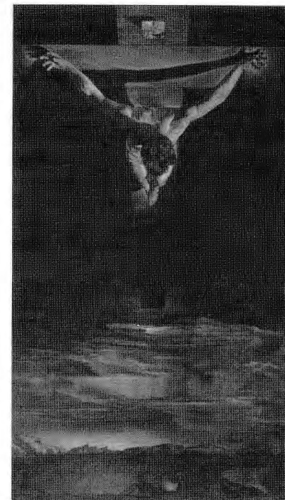
Salvador Dalí, Kristus Jana od Kříže

Restaurování je odrazovým můstkem k mnoha zajímavým objevům. Ukázalo se, že kresba byla nalepena na dvou různých podložkách: na pergamentu a na dřevě. Po odlepení kresby z obou podložek je jasné, že kresba je provedena na dvou kusech papíru. První, původní, svrchní, obsahuje kříž a část těla, druhý – novější, je umístěn vespod jako podložka elipsoidního tvaru,