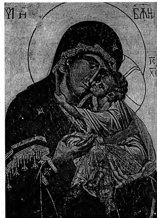
Bohorodička s Kristem Výřez, tempera na dřevě, 164,5x56 cm, legenda ve staroslověněštině, kolem roku 1350, ikonostas v klášteře v Dečanech, Srbsko. Z knihy IKONY, Gordana Babic, vydalo Karmelitánské nakladatelství 1997

průchozí oběma směry. Nás navyká pod povrchem našeho světa zahlédnout svět Boží a napojit se na něj. Zároveň působí, že i skrze nás může Boží velebnost sídlit v naší zemi (Ž 85,10).