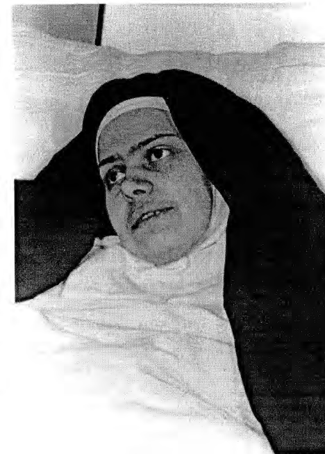
Z francouzštiny přeložila Alžběta Graubnerová.

Miluj mě, celý tvůj život se mi bude líbit, jen když mě budeš milovat!... Udělám v tobě veliké věci, v tobě budu poznáván, oslavován, chápán...“