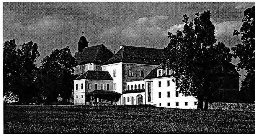
Klášter v Kostelním Vydří –.

Před šedesáti lety – 1. října 1946 zemřel v jihotyrolském Bolzanu Pavel hrabě Huyn (*17. 2. 1868 v Brně), někdejší brněnský biskup (1904–1916) a pražský arcibiskup (1916–1918). Také jeho přičiněním přišli v roce 1908 do Kostelního Vydří konečně (téměř dvě stě let po vzniku poutního místa Panny Marie Karmelské) bratři karmelitáni. Není tedy nadsázkou považovat natrvalo tohoto pastýře církve za dobrodince Karmelu a za spoluzakladatele kláštera.