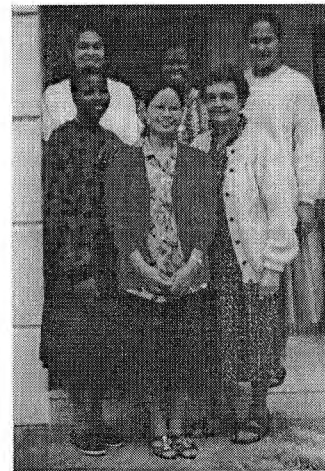
Text připravily sestry Donum Dei

Dejme nakonec slovo otci Rousselovi: „O co tedy jde sestram misionářkám práce? Říká se, že v dnešním světě nejvíc chybí svatost. A cílem sester nejsou velká sociální díla, ale zjevovat, odhalovat Boží lásku a tlumočit ji modernímu světu.“